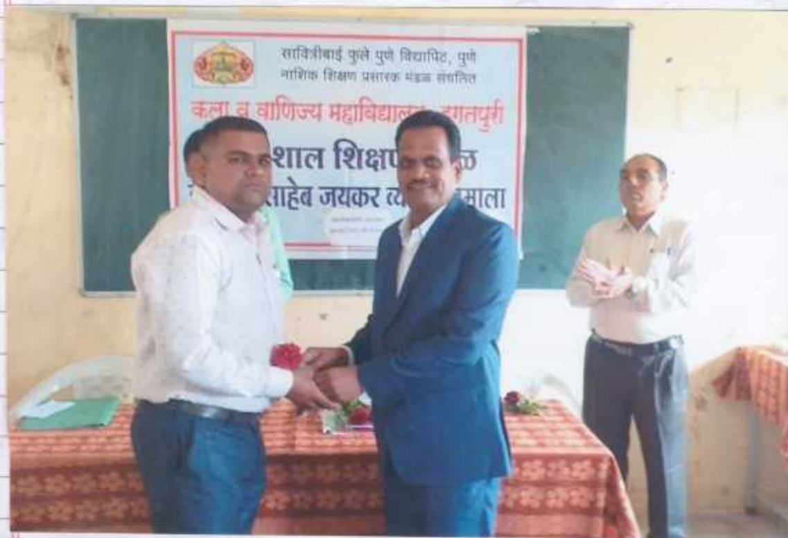
IQAC Co-Ordinator Nashik Shikshan Prasarak Mandal's Arts and Commerce College Igatpuri, Dist-Nashik