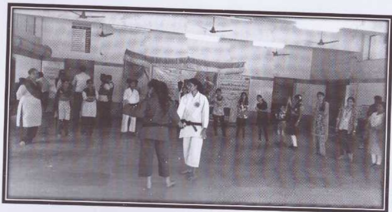
Demonstration for the Students by the Trainer