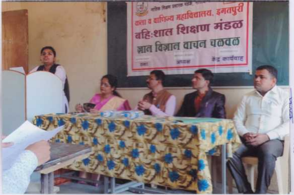
INCHARGE PRINCIPAL Nashik Shikshan Prasarak Mandal's Arts and Commerce College