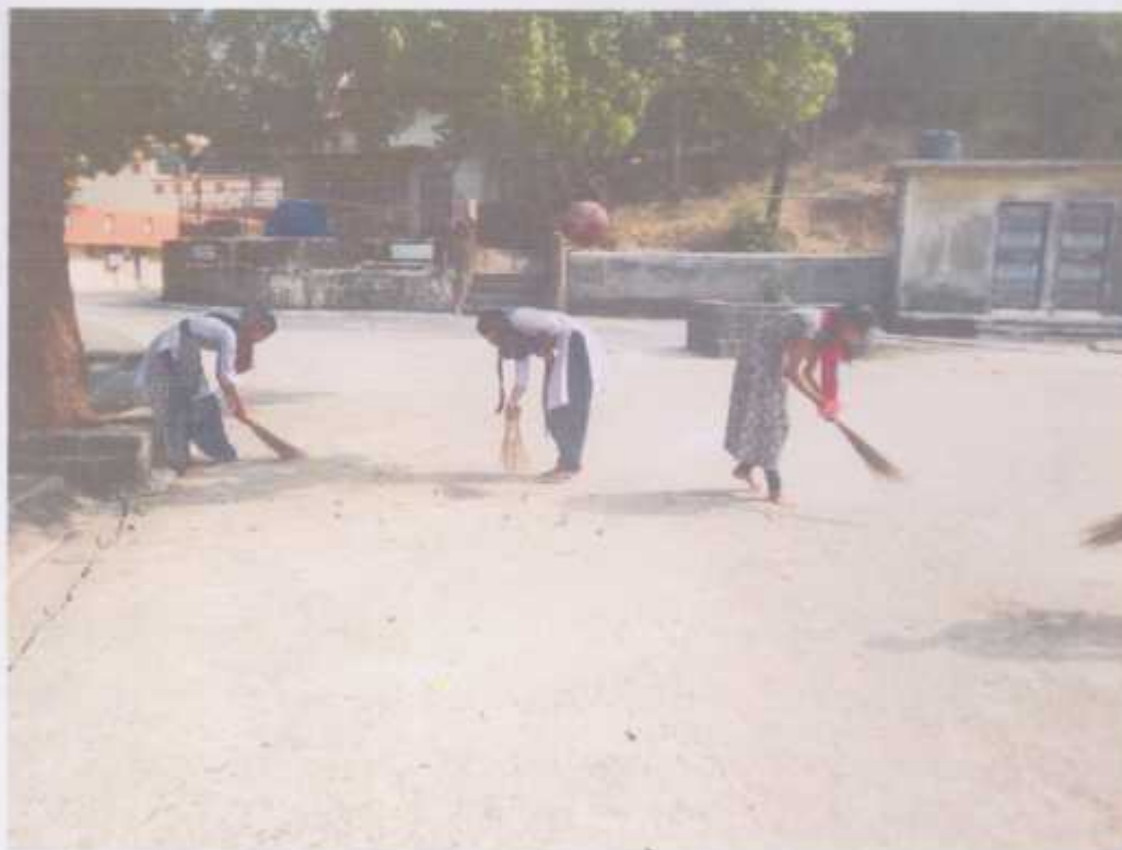
Clean Village & Temple