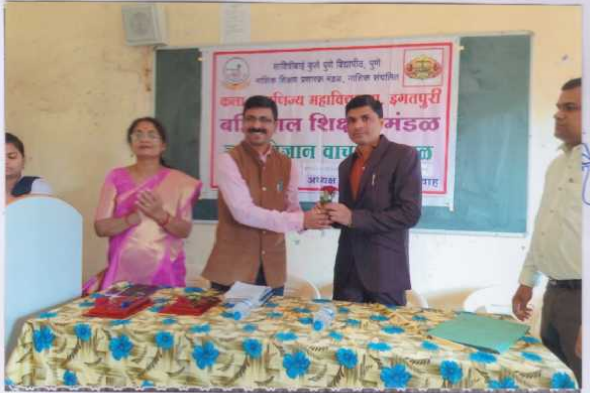
IQAC Co-Ordinator Nashik Shikshan Prasarak Mandal's Arts and Commerce College

केंद्र कार्यावाह वहिःशाल शिक्षण मंडळ कला वाणिज्य महाविद्यालय इगतपुरी, जि. नाशिक